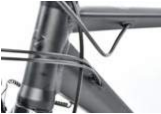
Aufgeräumte, gut erreichbare Zugverlegung.