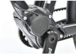
Wartungsarm, guter Schwerpunkt: Pinion 6-Gang-Getriebe.