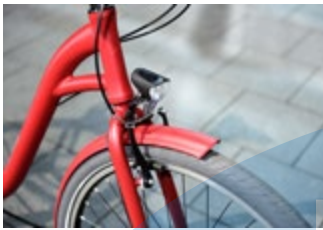
Scheint im Test heraus: der helle 70 Lux-Strahler.