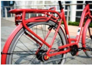
Multifunktionaler Träger mit kräftiger Optik.